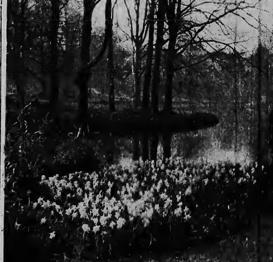
Vroege lentestemming op de Keukenhof, die binnenkort de poorten weer voor het publiek zal openen.

De prinses zal omstreeks kwart voor vier 's middags aan boord van het m/s Erasmus bij het monument arriveren, waarna de plechtigheid te ongeveer 15.50 uur begint met het spelen van The Last Post door de harmoniekapel van de Koninklijke Rotterdamse Lloyd.